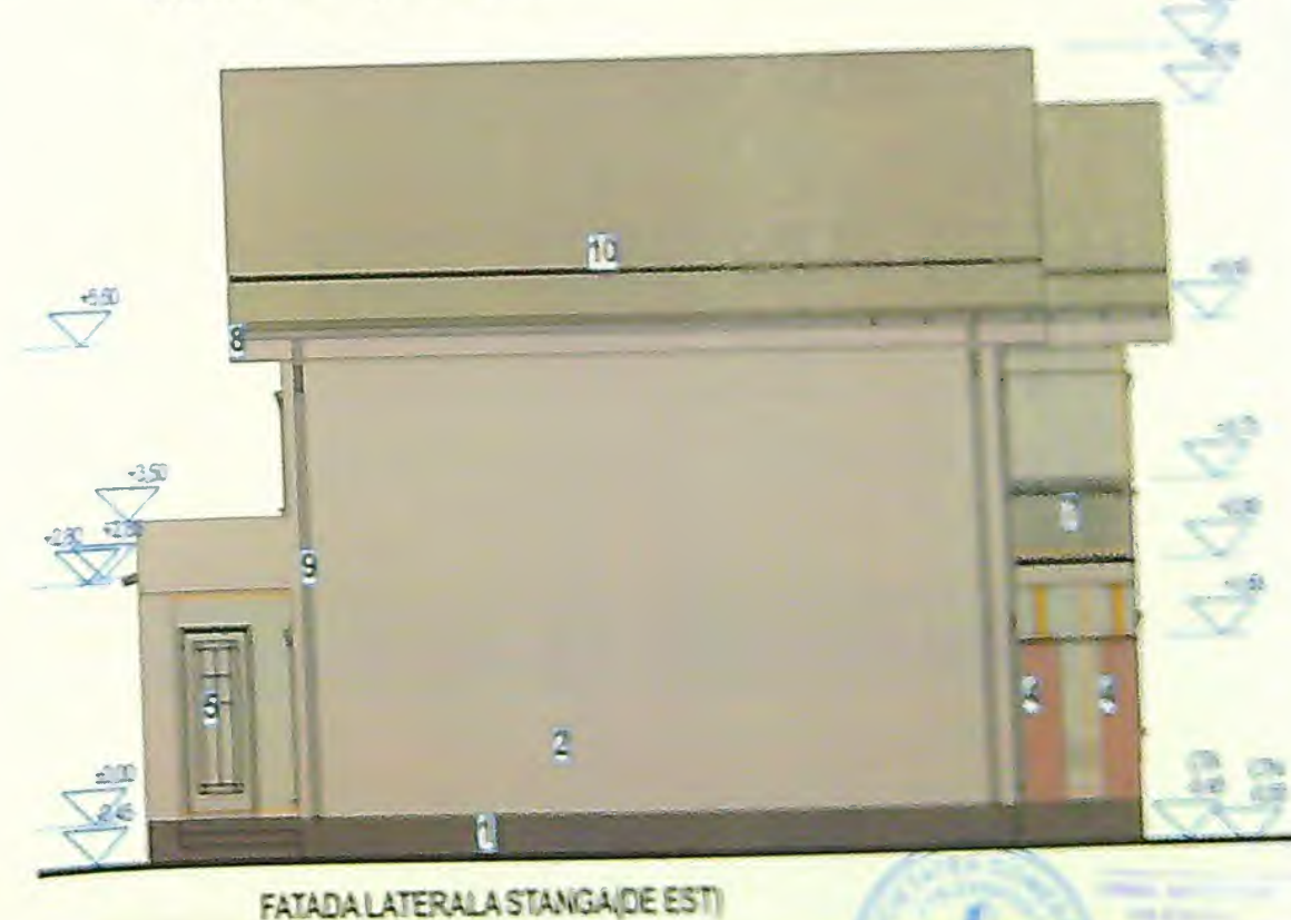
FATADA LATERALA STANGA(DE EST)

Finisaje: 1-sociu impermeabil; 2-tencuiala decorativa alba; 3-tencuiala decorativa crem; 4-stalpi din lemn casetati cu caramida aparenta; 5-caramiziu lacuit; 6-usi PVC antracit cu geam termopan securizat; 7-ferestre PVC antracit cu geam termopan securizat si deschidere de la Hp min 90 cm; 8-jgheab tabla alb; 9-turian tabla alb; 10-parazapezi.