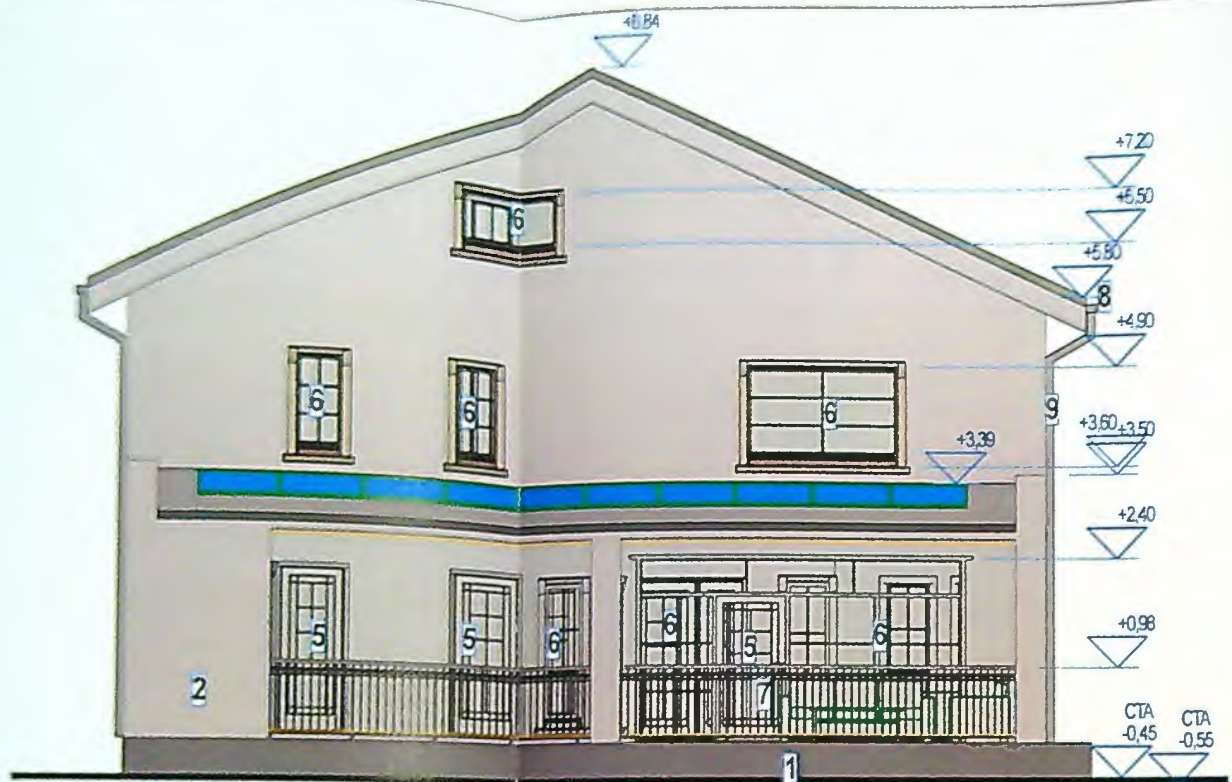
FATADA SECUNDARA(DE SUD)