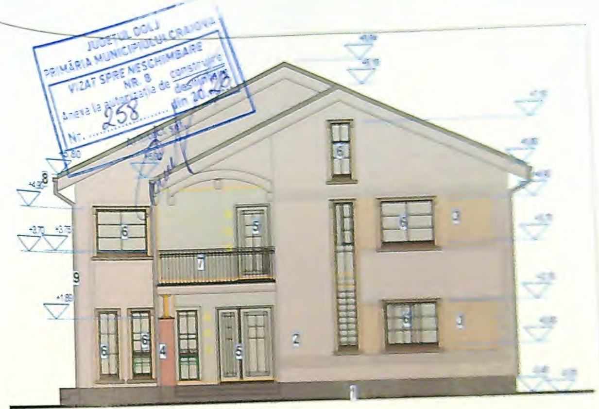
FATADA DE NORD(PRINCIPALA)